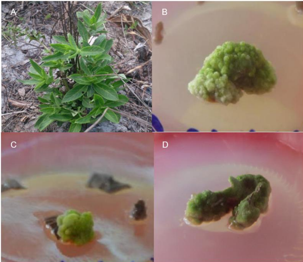
Hình 1. Cây nhân trần cát tự nhiên (A) và callus hình thành trên các môi trường tối ưu (B. từ đoạn thân, C. từ mảnh lá, D. từ cuống lá).